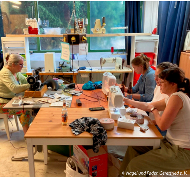
© Nagel und Faden Geretsried e. V.