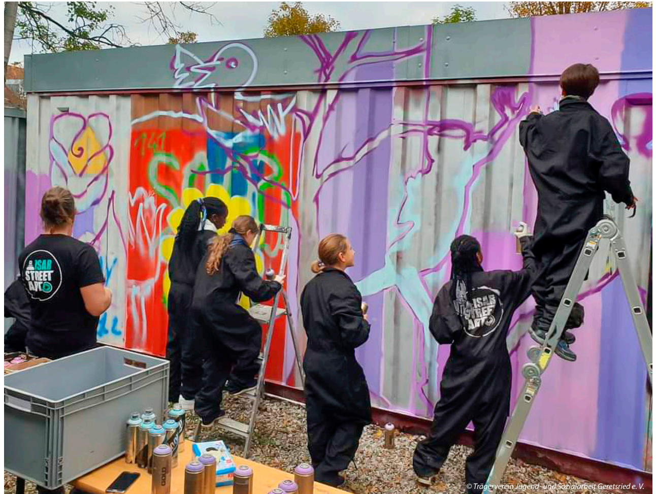
© Trägerverein Jugend- und Sozialarbeit Geretsried e. V.