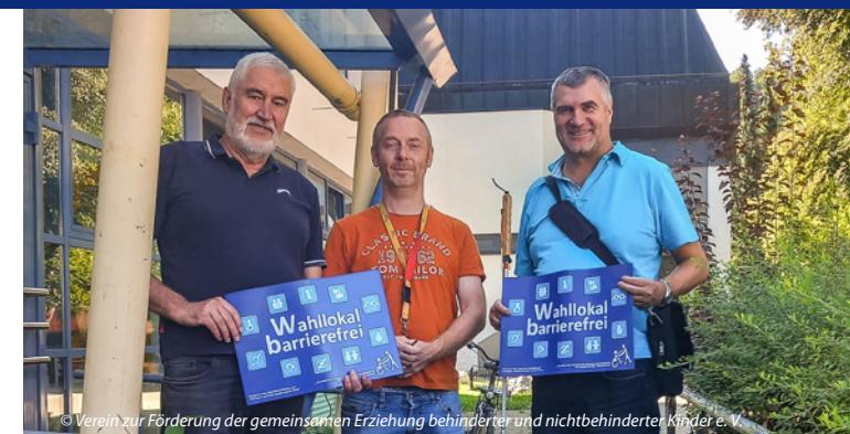
© Verein zur Förderung der gemeinsamen Erziehung behinderter und nichtbehinderter Kinder e. V.

Web: eltern.bke-beratung.de/views/system/anmelden.html