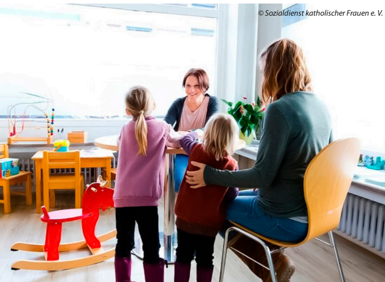
© Sozialdienst katholischer Frauen e. V.